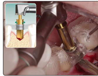
7. ガイドリーマー ガイドリーマーによりインプラント 窩を形成。 注：50RPM無注水