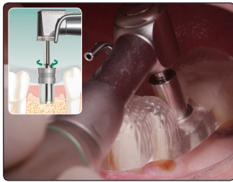
5. 埋入位置のマーキング 歯肉パンチによるパンチアウト、 またはフラップ位置のマーキング。