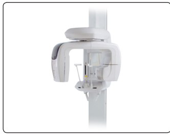
1. コーンビームCT撮影