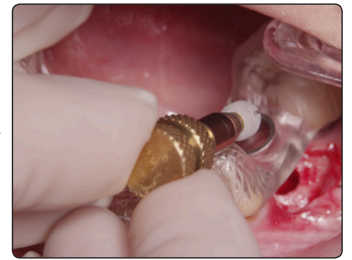
8. ガイドインサーター ガイドインサーターを使用し、イン プラント体を埋入。