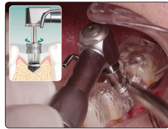
6. スペードドリル スペードドリルによってイニシャル ホールを形成。 注：400RPM注水