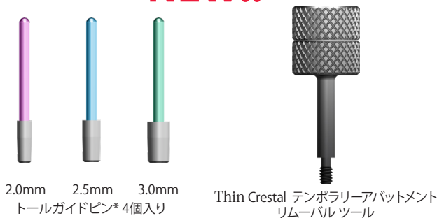
2.0mm 2.5mm 3.0mm トルガイドピン* 4個入り